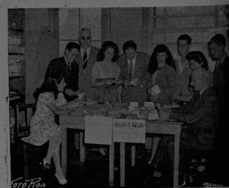
escrutar y anotar los numerosos cupones, demandó más de cuatro horas y media de labor...